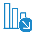
Zeichnungskapazität der Versicherer