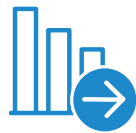
Zeichnungskapazität der Versicherer